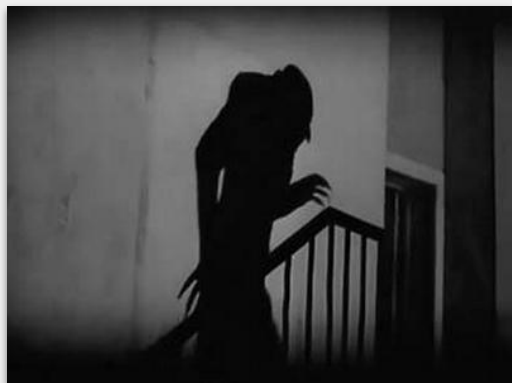
Nosferatu / 1922

La gigantesque ombre portée du vampire dramatise la menace imminente sur sa victime.