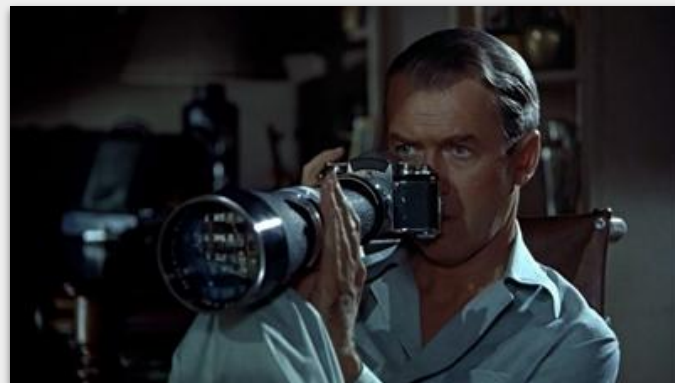
Fenêtre sur cour / 1955

L'intérêt de Jeffries pour l'immeuble voisin est indiqué doublement dans ce plan :