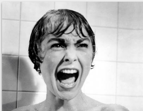
Psychose / 1960

Le visage terrifié de Marion Crane vers son agresseur hors-champ implique fortement le spectateur. Le champ donne ici consistance au hors-champ en termes émotionnels