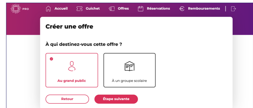
Capture d'écran de la fonctionnalité « À un groupe scolaire » dans le parcours de création d'offre accessible depuis l'espace pass Culture pro.

Pour proposer des offres à destination d'un groupe, vous devez être référencé auprès du ministère de l'Éducation Nationale et du ministère de la Culture. Faire une demande de référencement