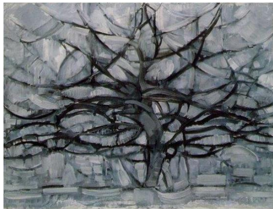
L'arbre argenté, Piet MONDRIAN, 1911