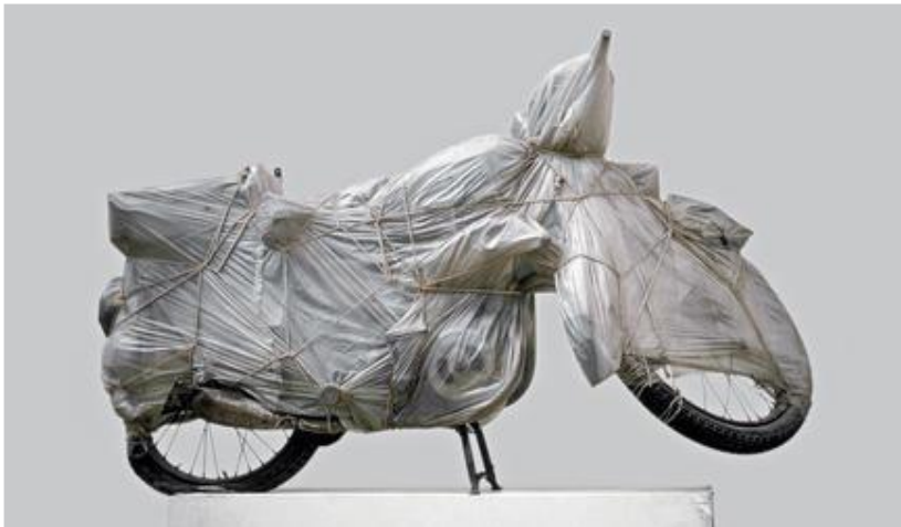
Motocyclette emballée, 1962, Christo