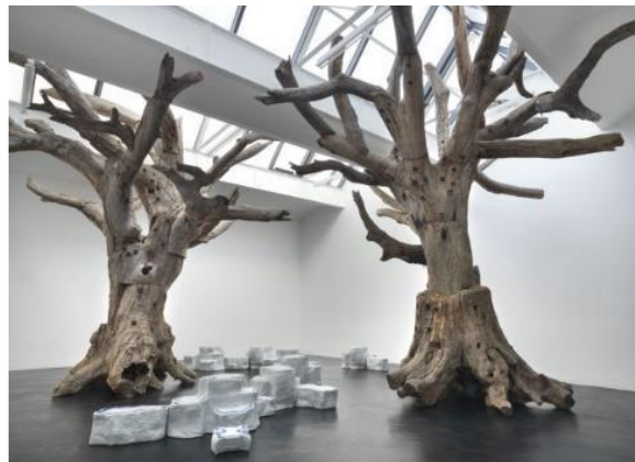
Iron Tree, Ai Weiwei, FIAC Paris, 2013