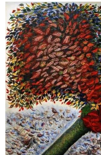
L'Arbre rouge , Séraphine Louis (1928-30)