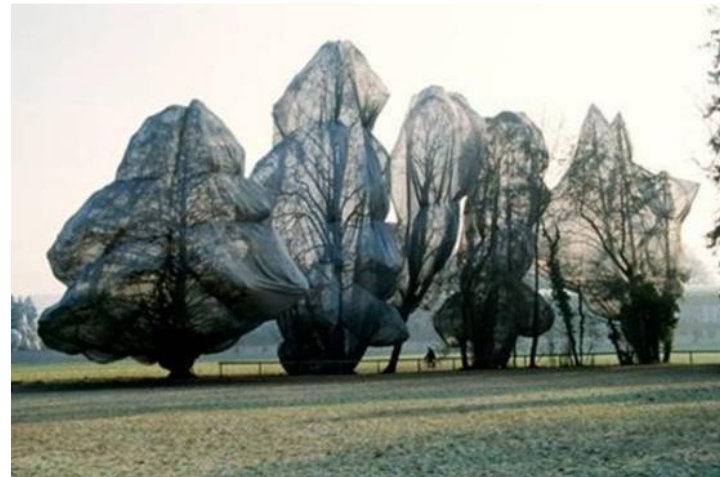
Arbres enveloppés, 1998 Christo et Jeanne-Claude