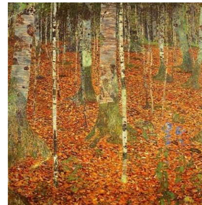
Forêt de bouleaux, Gustav Klimt , 1903